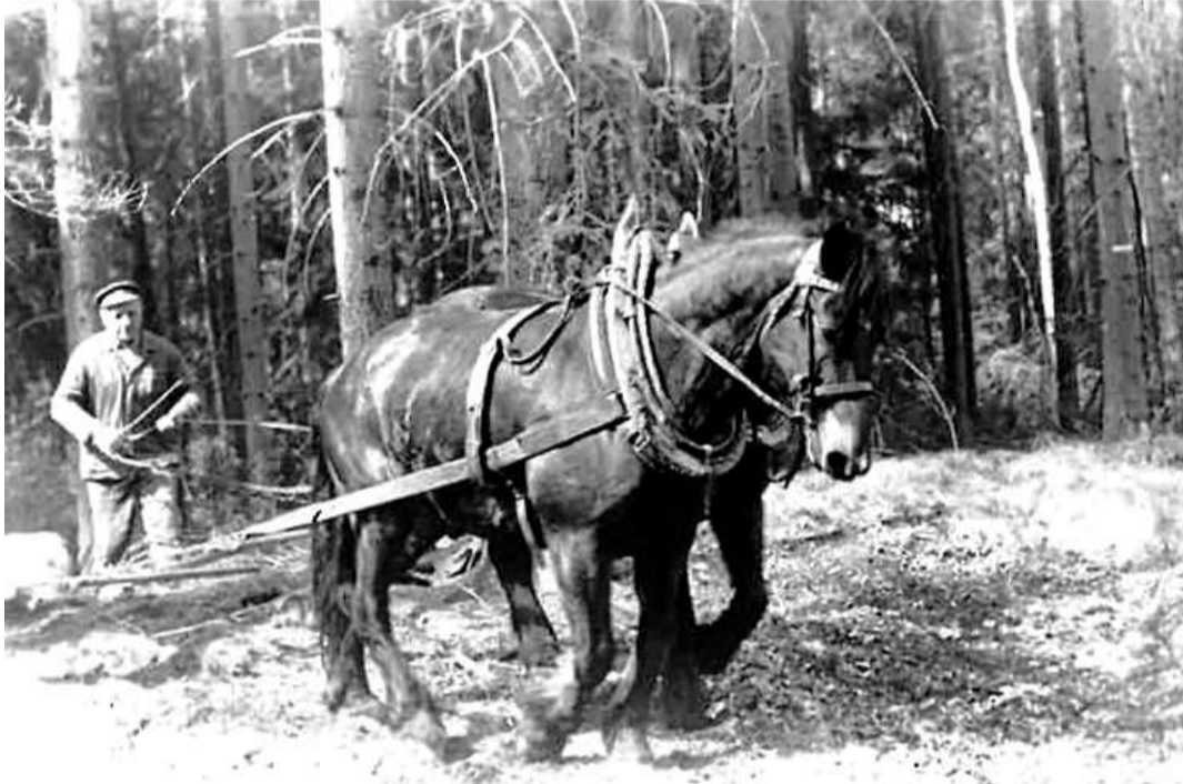
Koně Karel Zimmer pracoval s koňmi za války i po ní, těžil s nimi dřevo v lese. Kvůli větším výdělkům jezdil na Šumavu. Tam pobýval půl roku a domů se vracel jednou za 14 dní na víkend.