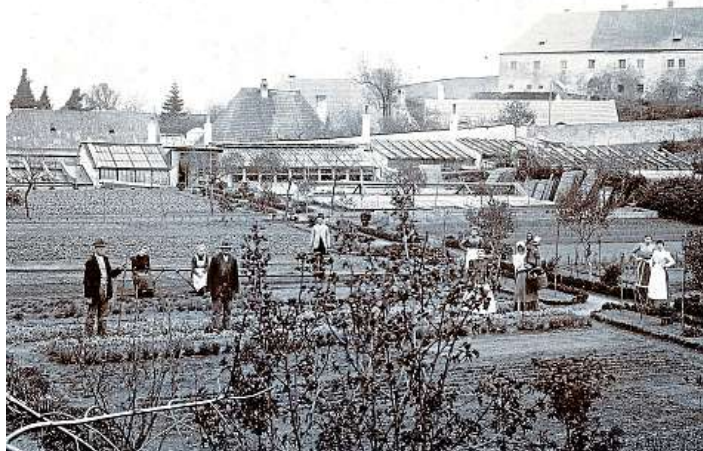
Rodina při práci Na fotografii přibližně z roku 1900 je Krafferova rodina, která se postarala o její rozkvět.

Tím se otevřela zlatá éra Krafferova zahradnictví, ve kterém pracova-