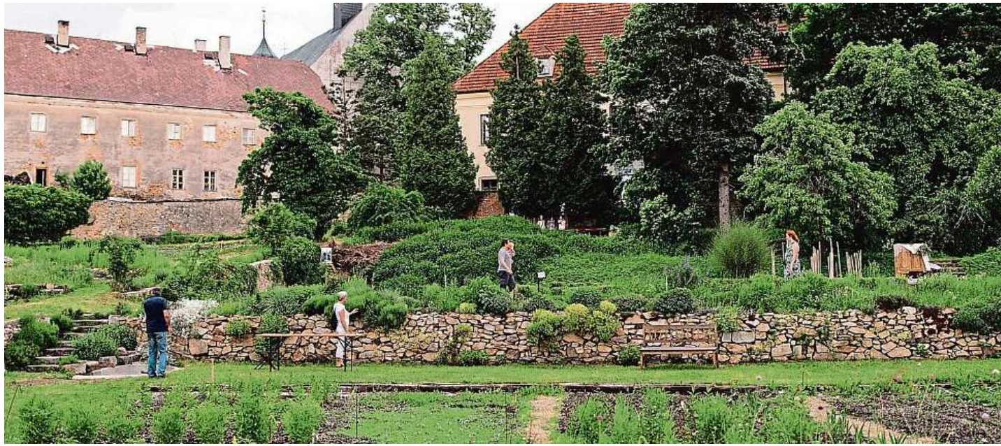
První návštěvníci Upravenou Krafferovu zahradu lidé poprvé spatřili vloni na Víkend otevřených zahrad.

hradnická profese a bude tu ateliér. Stane se takovým komunitním místem v centru Jindřichova Hradce,“ zamýšlí se další členka skupiny Anna Makovičková. Nikdo jiný prostor nechťel, a tak vyhrál.