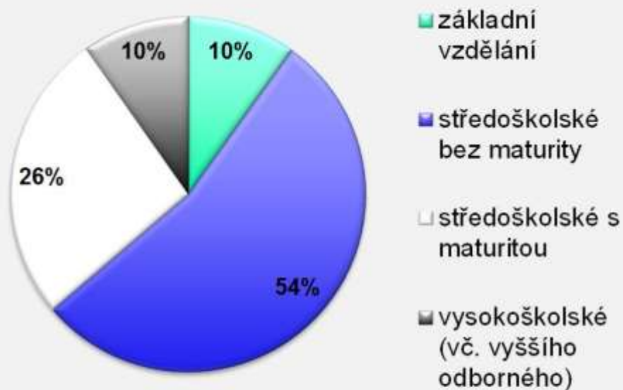
Vzdělanostní profil zaměstnanců v zemědělském sektoru v roce 2014